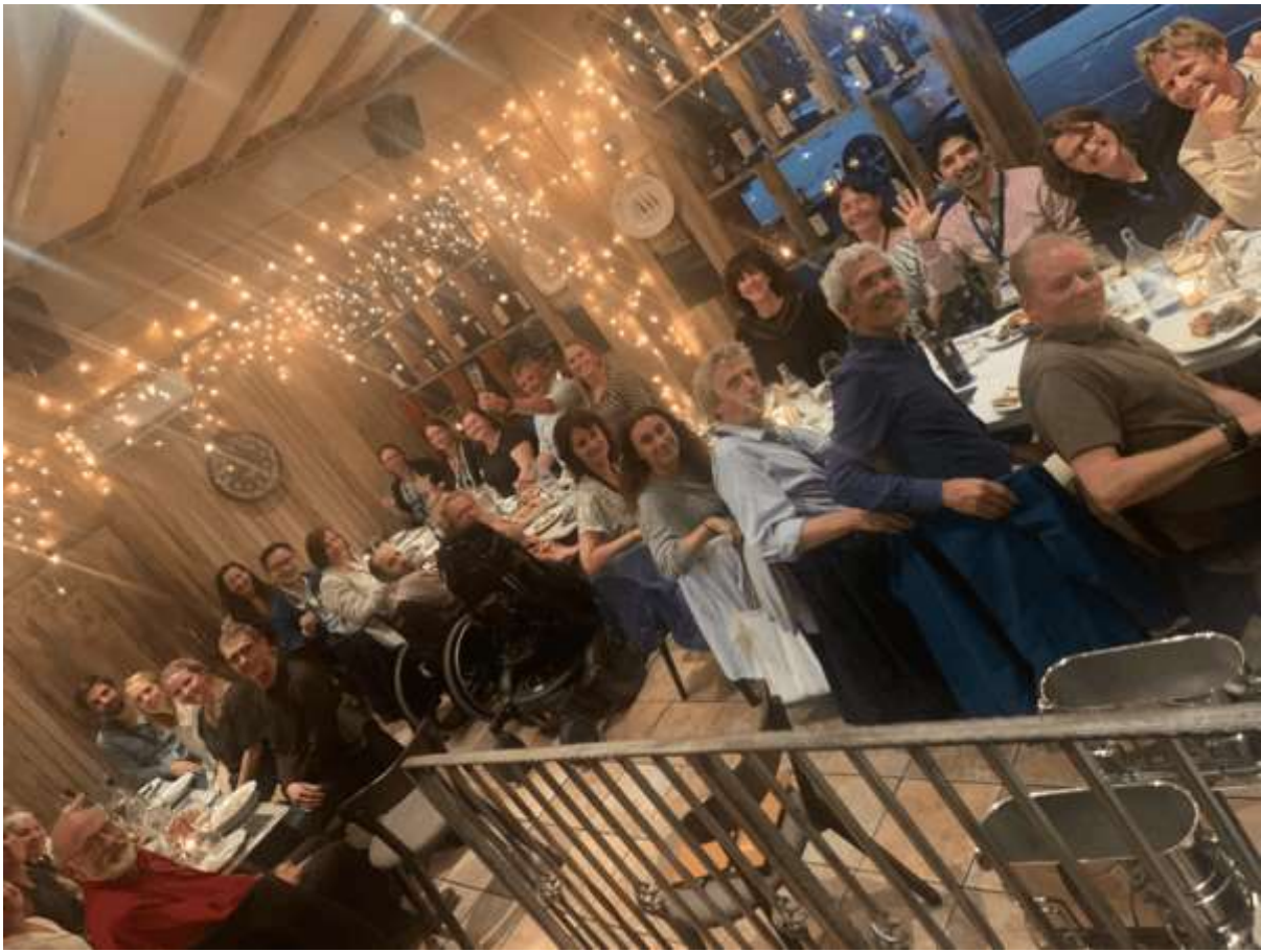
Impressie van de OI-top in Sheffield