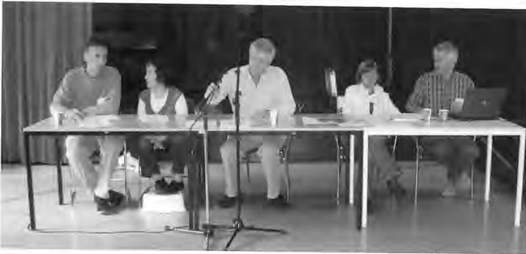
het bestuur – v.l.n.r.